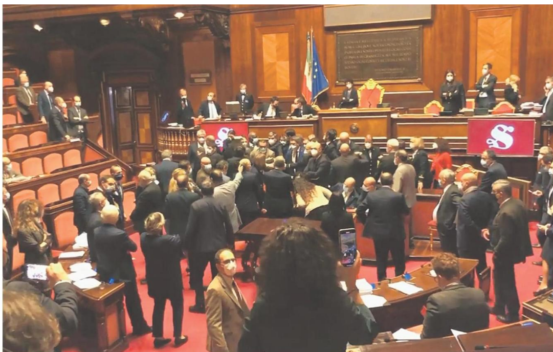
Bagarre in Senato, lo scorso 17 dicembre, quando il ministro per i Rapporti col Parlamento Federico D'Inca aveva posto la questione di fiducia sul decreto sicurezza

Il vero confronto non sarà più tra sinistra e destra ma tra favorevoli e contrari all'Europa unita